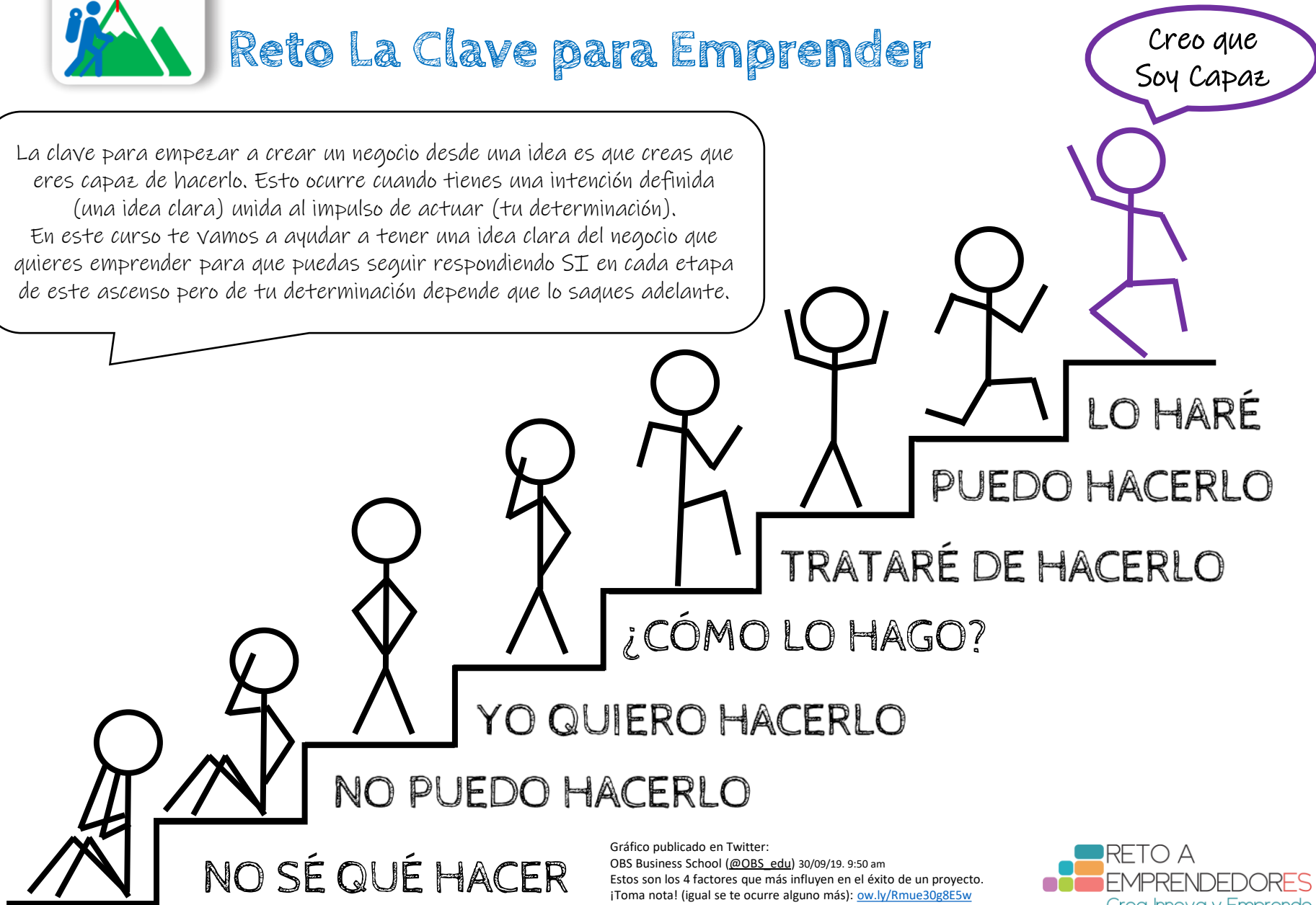
Gráfico publicado en Twitter: OBS Business School (@OBS_edu) 30/09/19. 9:50 am Estos son los 4 factores que más influyen en el éxito de un proyecto. ¡Toma nota! (igual se te ocurre alguno más): ow.ly/Rmue30g8E5w pic.twitter.com/SZBU7AvYcq

La clave para empezar a crear un negocio desde una idea es que creas que eres capaz de hacerlo. Esto ocurre cuando tienes una intención definida (una idea clara) unida al impulso de actuar (tu determinación). En este curso te vamos a ayudar a tener una idea clara del negocio que quieres emprender para que puedas seguir respondiendo SI en cada etapa de este ascenso pero de tu determinación depende que lo saques adelante.